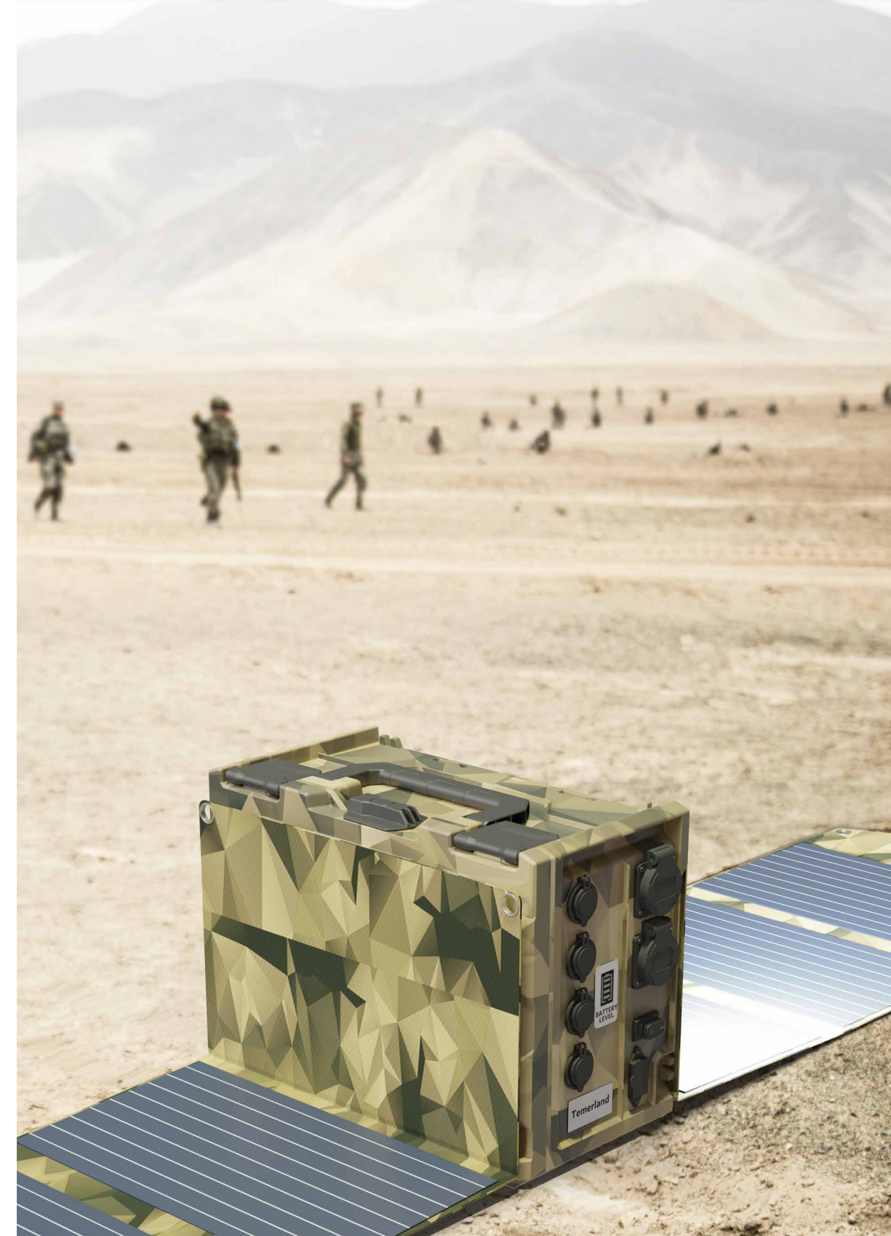
ПОЛЕВАЯ ЗАРЯДНАЯ СТАНЦИЯ TEMERLAND

ООО "ТЕМЕРЛАНД" 69001, Украина, г. Запорожье, бул. Тараса Шевченко, 56 E-Mail: sales@temerland.com Tel.: +38 (061) 213 78 55 Mob.: +38 (050) 100 97 96 Web: www.temerland.com